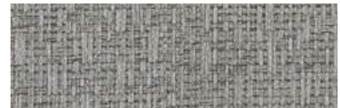
MARABELLA 94 PEWTER