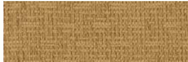
MARABELLA 508 WHEAT