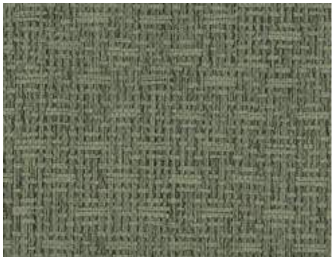
MARABELLA 22 OLIVE