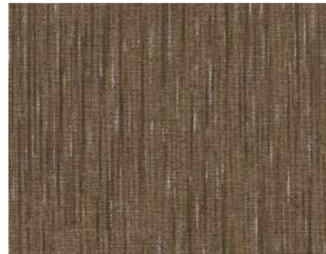
QUENTIN 84 TWEED