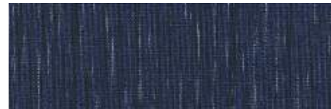
QUENTIN 306 NAVY