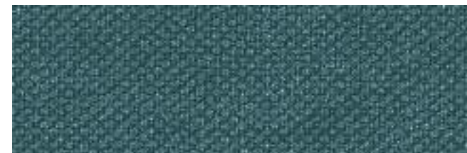
LISBURN 24 PACIFIC