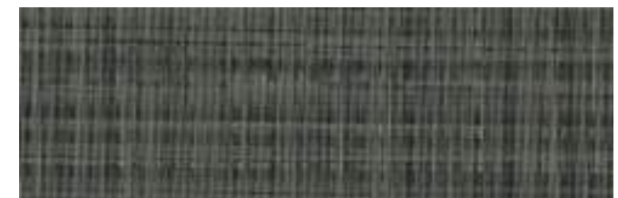
TRIPOLI 905 SHADOW