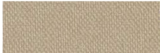
LISBURN 67 FLAX