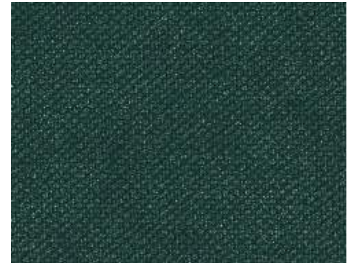
LISBURN 345 JUNIPER