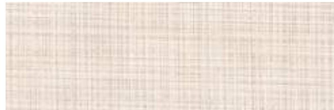
TRIPOLI 706 PARCHMENT