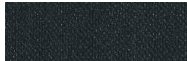
QUENTIN 908 MIDNIGHT