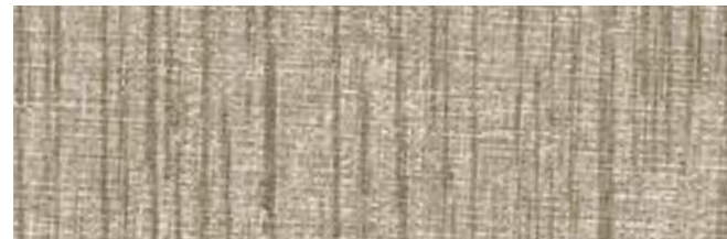
QUENTIN 608 VINTAGE