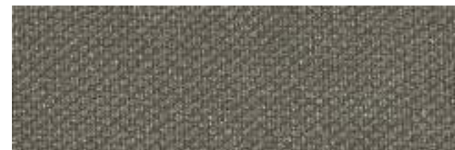
LISBURN 608 SPARROW