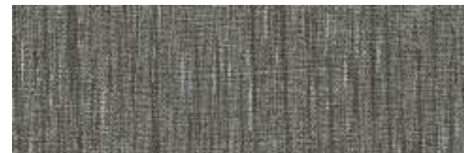
QUENTIN 905 GUN METAL