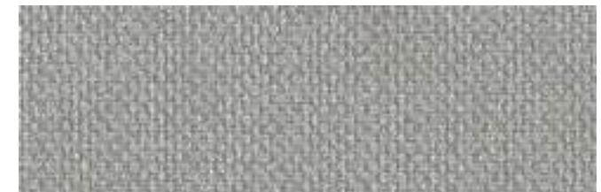
LISBURN 902 STONE