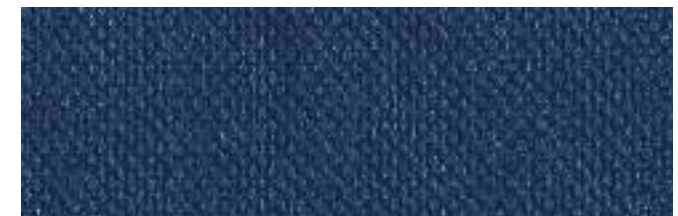
LISBURN 303 ADRIATIC SEA