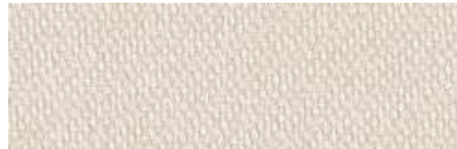
LISBURN 602 LINEN