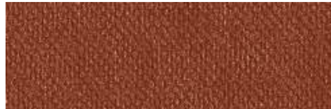
LISBURN 406 AMBER

Lisburn, Marbella, Tripoli et Quentin sont toutes des villes historiques où le lin a été créé. En l'honneur de l'histoire, nos quatre nouveaux motifs portent leur nom. Ces quatre motifs reflètent tous la texture et le tissage délicats d'un véritable lin, tout en ayant la durabilité et les propriétés ignifuges d'un tissu enduit. Ils sont conformes à la Proposition 65 et à la norme AB2998 et conviennent à toutes les applications contractuelles.