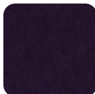
1008 DEEP PURPLE