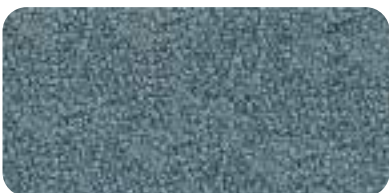
306 TRUE BLUE