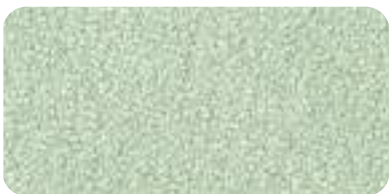
31 DUCK EGG